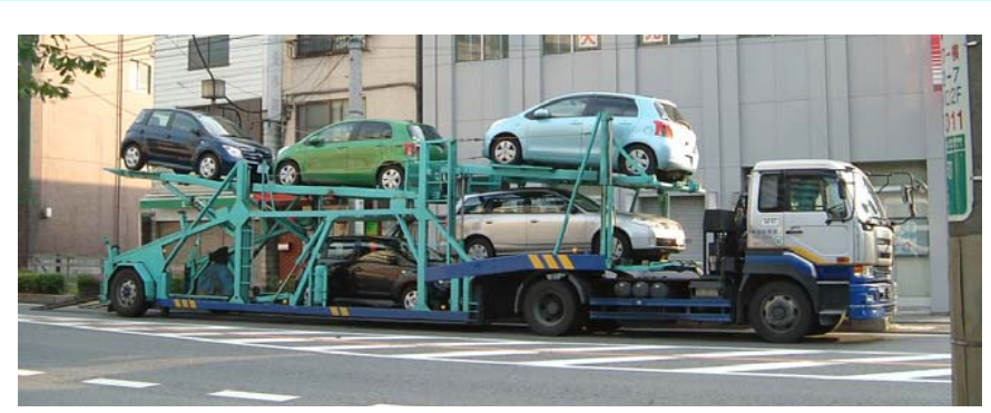
キャリアカーを利用して、島外へ搬出