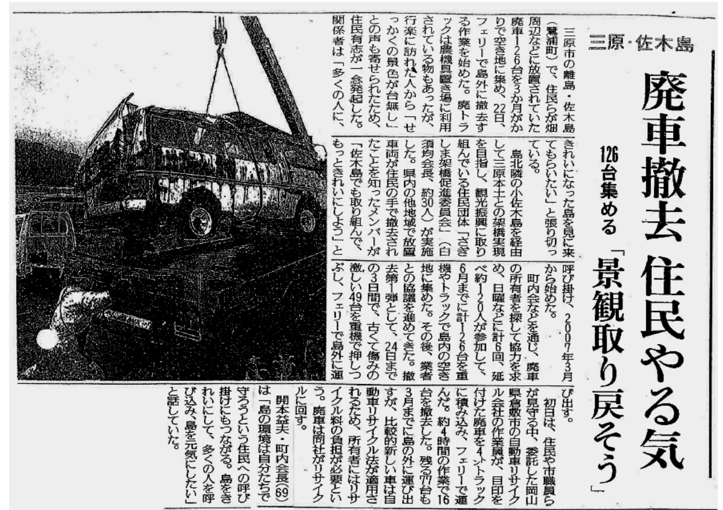
【参考】 三原市 佐木島 放置車両撤去に関する記事 平成20年1月23日(水) 読売新聞