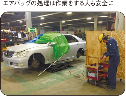
エアバッグの処理は作業をする人も安全に

車がしゅうげきを受けたとき一瞬でふくらみ、乗っている人を守るエアバッグも、解体中に何かのきっかけでふくらんだら危険です。このため、作業をする前に電気を通してふくらませておきます。