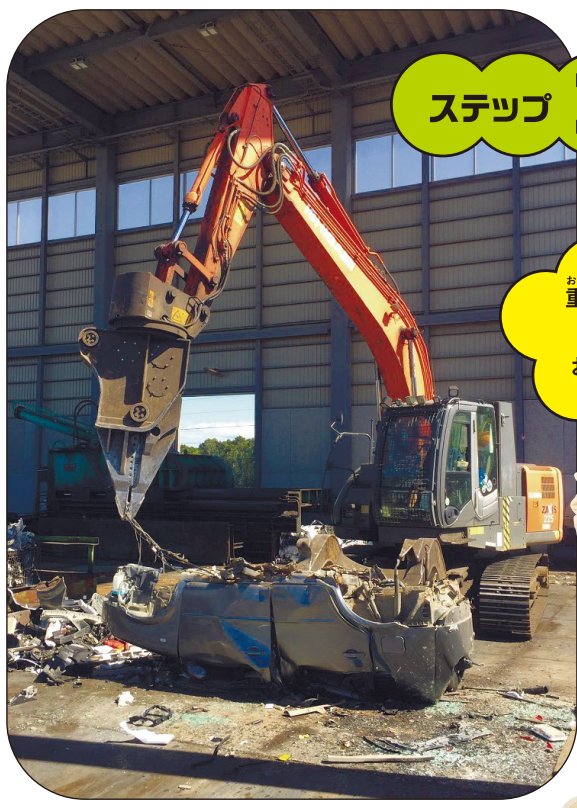
硬くて重い部品もニプラが次々と解体!