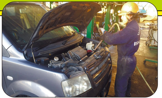
フロンガスの回収は、外にもれないよう細心の注意を払って