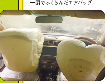
一瞬でふくらんだエアバッグ