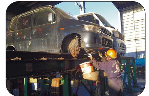
解体工場では、まずガソリンやオイルを回収します