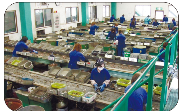
機械による分別後、人の手でさらに不純物が取り除かれます