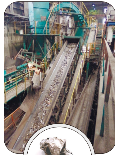
青森工場は、重さにして1時間に約40〜50tの破砕処理ができます。また、本シュレッダーでは、細かく砕くだけでなく丸い状態にします