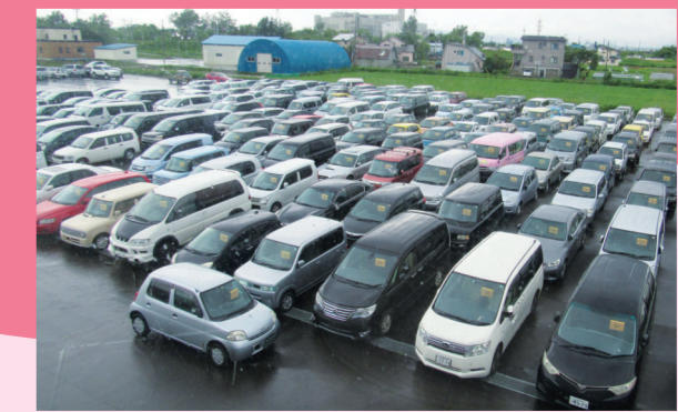
建物の外には出品前のクルマがたくさん並んでいたよ