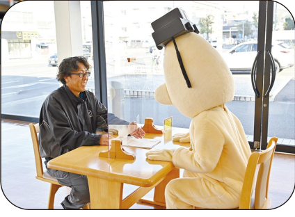
リサイクル部品に関する向原工場長の説明に博士も納得！