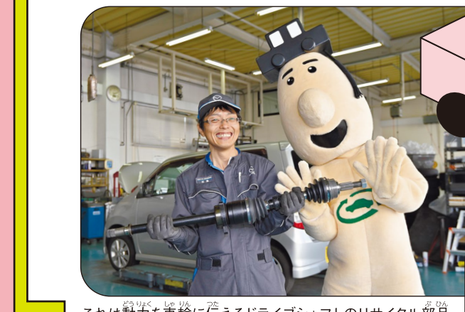
これは動力を車輪に伝えるドライブシャフトのリサイクル部品