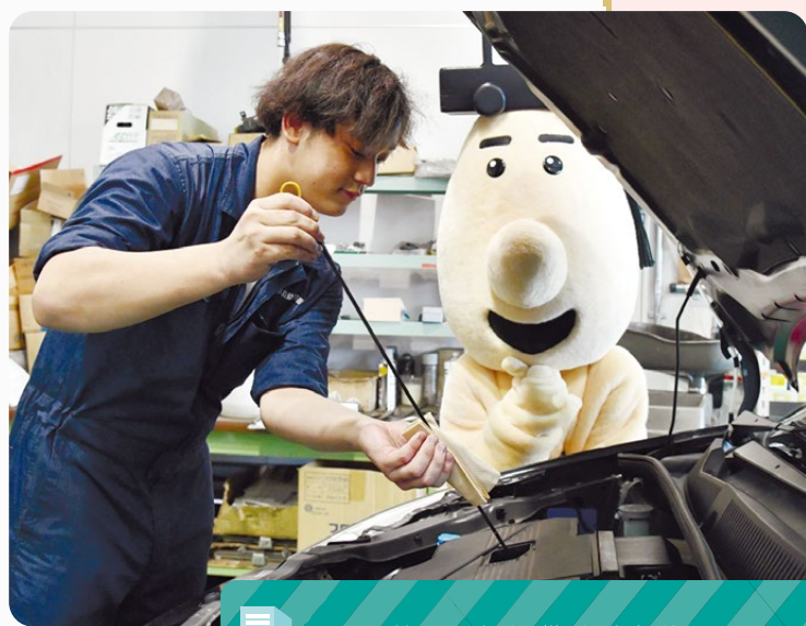
▲手際のよいオイル交換に、博士も納得!

社名: 北日本自動車共販 住所: 北海道札幌市 運輸局指定工場として車の点検・整備を行っています http://www.kitanihon-car.co.jp