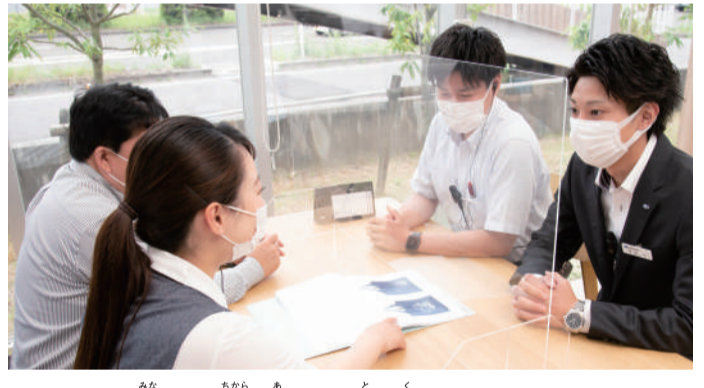
▲スタッフの皆さんが力を合わせて取り組んでいるよ

最近の車は、人に優しく、環境に配慮する方向へどんどん進化しているよ。そんな中、宮城スバルは「車の流通に関わる全ての過程で環境への負荷を減らしたい」という想いから、たくさんの工夫を続けているよ。そして「電気や水、紙などの使用量を減らす」「車を修理するときに出るゴミをきちんと分別する」などの努力を続けた結果、環境省による「エコアクション21」という認証を取得しているんだ！こんなに大きな成果を出せたのは、みんなが数値を見て話し合いながら、地道に改善を続けたからなんだって。