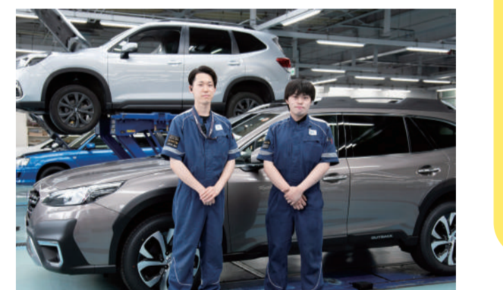
▲ツナギがカッコいい！

自動車販売店は、車を売っているだけのお店じゃない！宮城スバルには、技術と知識を持ったメカニックの方々がいて、愛車に関する悩みや不安を解決してくれるんだ。万が一、交通事故に遭ったり、車体を傷つけてしまったら、車を傷つけないで修理することができるとあって、整備を終えた車を見せてもらったら、ピカピカで驚き！これなら、ずっと安心して車に乗れそうだな。